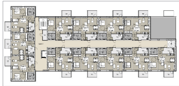
Figuur 2 Plattegrond van een bouwlaag